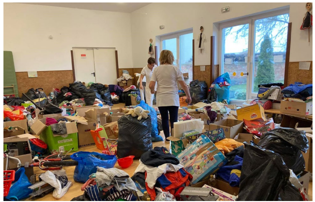
Amikor a kosár már kevésnek bizonyult, még ha oly nagy is volt...