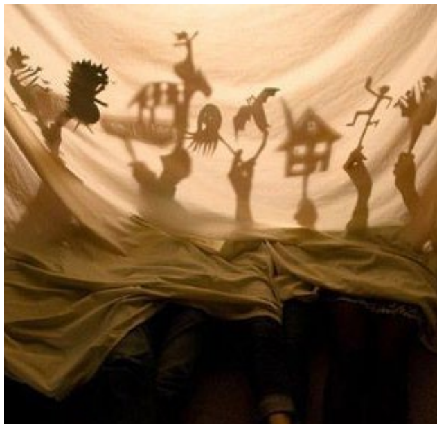
Árnyjáték és árnyszínház

Készítsünk sok-sok kör alakú kartonlapot, melyekre különböző formákat rajzolunk, majd a körvonalak mentén egyenlő távolságban kilyukasztgatjuk. A könnyebb rögzítés miatt érdemes muffinpapírra készíteni, és ezeket cserélgetve az elemlámpán, már indulhat is a játék!