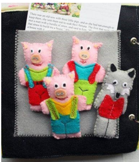
Mesék a zsebből, amihez tökéletes a megunt, szakadt farmer