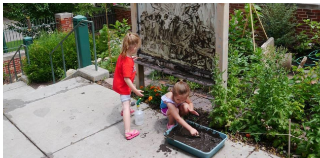
Sárdobáló játék és festés sárral

A „gyerekbarát kert” szinte elengedhetetlen része a sárkonyha, melynek kialakításához nincs is olyan sok mindenre szükség: egy kiszuperált mosogató, néhány raklap és egy ügyes kezű apuka vagy gondnok, és néhány óra alatt már kész is az új játszóhely. Kialakításával azt is megelőzhetjük, hogy a kert, udvar egész területén sáros felületeket kelljen nap mint nap letakarítani.