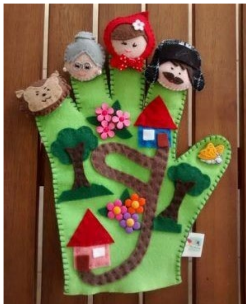
Kesztyűbábok egy kicsit újragondolva

Nyáron könnyű szép kavicsokat gyűjteni (vagy – ha ez nem sikerül – hobbi- vagy kertészeti áruházakban besze-rezhető), szép formájú kavicsokat válogatni, melyekre alkoholos filccel, hobbifestékkel rajzolva-festve, valamint papírból kivágott, felragasztott figurákkal, hátterekkel díszítve őket, már kész is a mesekavics, amit csak elő kell vennünk, amikor a mese éppen előkerül az év folyamán. (Két praktikus ötlet: az elkészült kavicsokat érdemes lelakozni, hogy tartósabbak legyenek, és érdemes őket mesénként egy-egy összehúzható kis zsákban tárolni.)