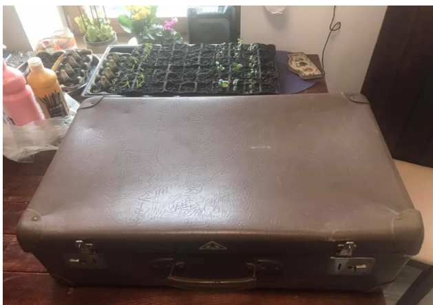
Mesék a bőrdönből vagy dobozból